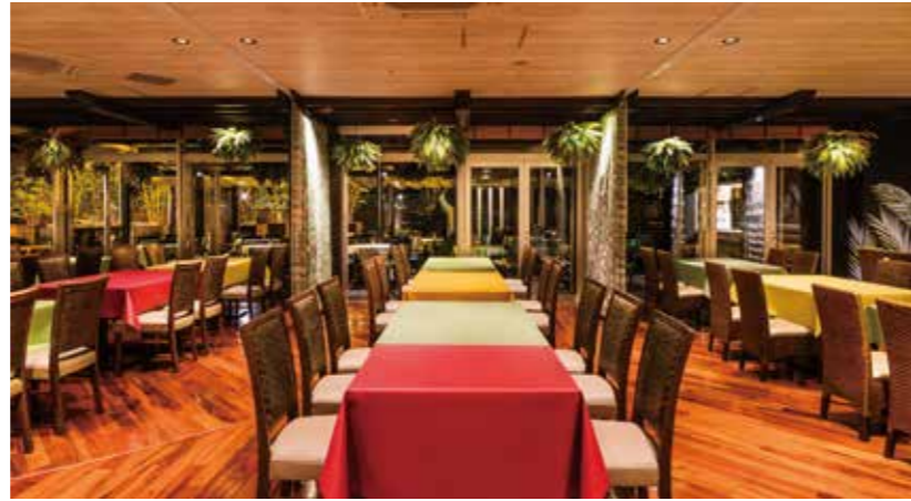
テラスに隣接したガーデンルームはエアコン完備で、快適に過ごせる人気のスペース。