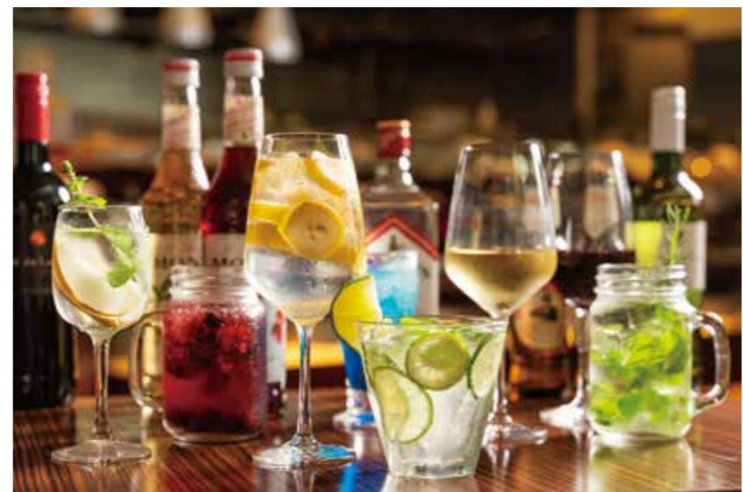
アレッタビアガーデンでは35種類のアルコールのほか、ノンアルコールやスムージー、デトックスウォーターなど、女性に嬉しい43種類のノンアルコールも飲み放題。