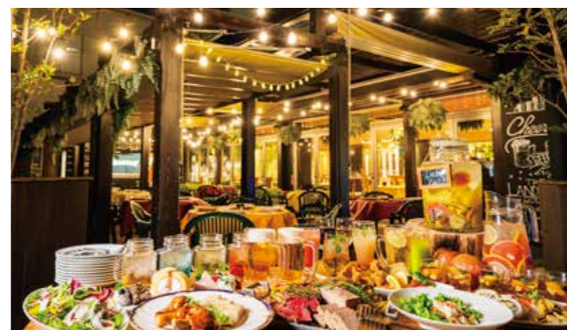
目の前に広がるリゾート空間に、思わず街中であることを忘れてしまう。

世界をイメージした店内の[ワールドゾーン]もございます! アメリカゾーン36席 / ヨーロッパゾーン56席 / アフリカゾーン14席