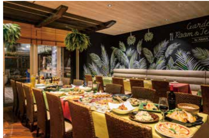
ガーデンルームはパーティションで3分割することができ、最小10名からでも貸切がOK。