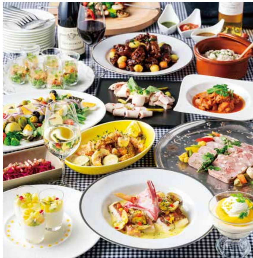
オードブルからサラダ、スープ、メイン、デザートまでフルコース仕立てで料理が楽しめる。