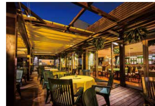
開閉式の屋根を持つパーゴラテラス。晴れていれば全開で、星明かりが降りそそぐ夜に会える。

宮崎で「世界グルメ」といえば、山形屋新館最上階の「アレッタ」。 ホテル出身のベテランシェフによるこだわりのメニューが食べ放題 で楽しめる、元祖ワールドグルメレストランだ。多彩な空間も魅力 の一つで、大通りを見下ろすボックスシートなどのワールドゾーン、 貸し切り可能な大中小の個室、雨でも安心な全天候型のパーゴラ テラス、夏気分満喫の開放的なオープンテラスなど、オアシスイ夏 が過ごせる空間がアレッタにはすべて備わっている。 そして、今や宮崎の夏の風物詩となった「アレッタビアガーデン」が 7月1日から今年も登場する。7~8月の期間中は、これまで20年間の アレッタのフェアの中でもTOP3の人気を誇るフランス、イタリア、 スペインの料理が一度に楽しめる「欧州三大グルメフェア」が開催 されるほか、毎日開催のイベントや肉食女子必食の「世界の肉料理 グランプリ」も実施と、まさにグルメ尽くし。コロナで海外旅行に も行きづらい昨今、ぜひ「アレッタビアガーデン」でパチャルなグルメ 世界旅行を楽しんでほしい。